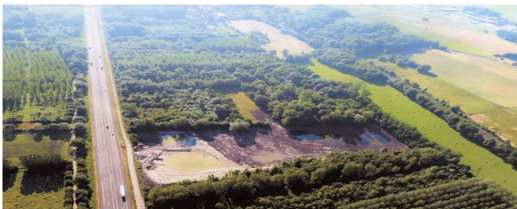
Mesures compensatoires mises en place avec la création de mares et de bassins de stockage pour faire face à une crue centennale

Le comité de suivi, pour sa part s'est déjà rendu deux fois sur le site et lors de réunions a préparé un certain nombre de questions qui a permis de nourrir les débats des deux réunions de CLIS.